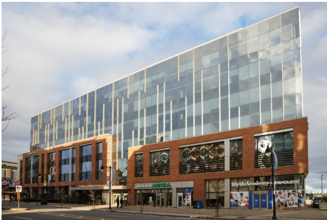
979 rue Bank

Montréal (Québec) 10 janvier 2022: le Fonds de placement immobilier BTB (TSX : BTB.UN) (« BTB » ou le « Fonds ») annonce l'acquisition de deux propriétés de bureaux de Classe A situés au 979 and 1031 rue Bank (collectivement les « Propriétés ») à Ottawa, en Ontario. Les Propriétés sont situées dans le quartier Glebe, au sud du centre-ville d'Ottawa, (voir ci-dessous pour une description du quartier), ce dernier étant un des quartiers plus branchés de la ville.