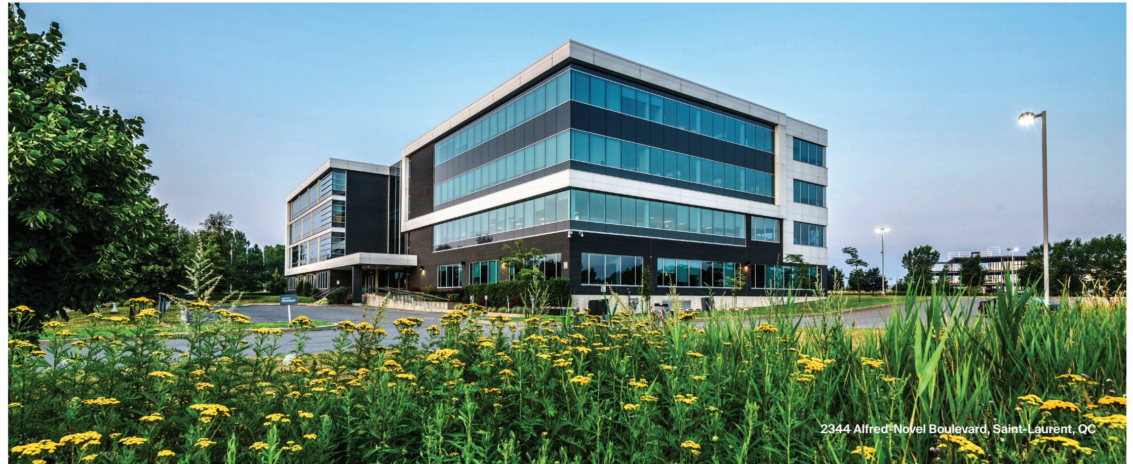
2344 Alfred-Novel Boulevard, Saint-Laurent, QC

En 2023, nos efforts se sont concentrés sur la mise en place de notre programme ESG, la formalisation de la surveillance et de la responsabilité, et le début de l'exécution des initiatives de notre feuille de route.