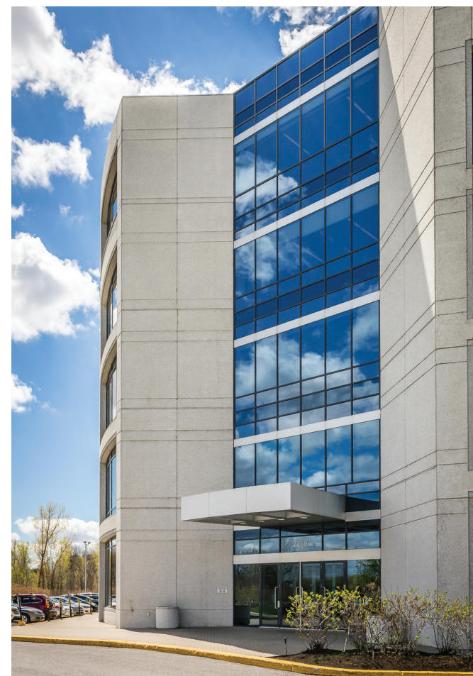
Rénovation de l'éclairage LED en 2022 2250 Alfred-Nobel, St-Laurent, QC

Les certifications de bâtiments écologiques nous permettent d'établir des normes élevées et cohérentes de performance environnementale dans l'ensemble de notre portefeuille. En 2023, nous avons entrepris 8 recertifications de propriétés BOMA BEST. La certification BOMA BEST démontre de solides pratiques en matière de gestion de l'énergie, de l'eau, des déchets et de la qualité de l'air. Actuellement, 42 %* du portefeuille de BTB est certifié BOMA BEST et LEED et nous visons 100 %* d'ici 2025. Notre Vice-président des opérations est le président du comité technique de BOMA, qui soutient le perfectionnement de la norme au fil du temps.