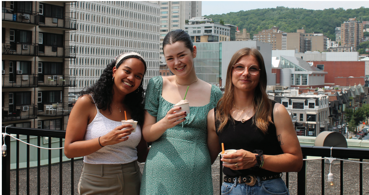
Atelier de plantation et déjeuner pour les employés, bureau de Montréal, juillet 2023

En 2023, nous avons organisé une formation ESG pour renforcer les capacités organisationnelles et les connaissances autour de l'intégration de la durabilité et des meilleures pratiques dans l'immobilier. La formation a été mise à la disposition des cadres et des employés pour lesquels le développement durable fait partie de leurs rôles et responsabilités. Nous proposons également des formations liées aux aspects sociaux de l'ESG à tous les collaborateurs, comme une formation en santé mentale. De plus, nous avons un programme de coaching en leadership afin de doter nos gestionnaires des compétences en leadership nécessaires pour soutenir leurs équipes et contribuer à leur avancement de carrière chez BTB. Le programme aide à établir des relations solides entre les employés et leurs superviseurs. En 2023, 43 % de nos gestionnaires ont bénéficié d'un coaching en leadership dans le cadre du programme.