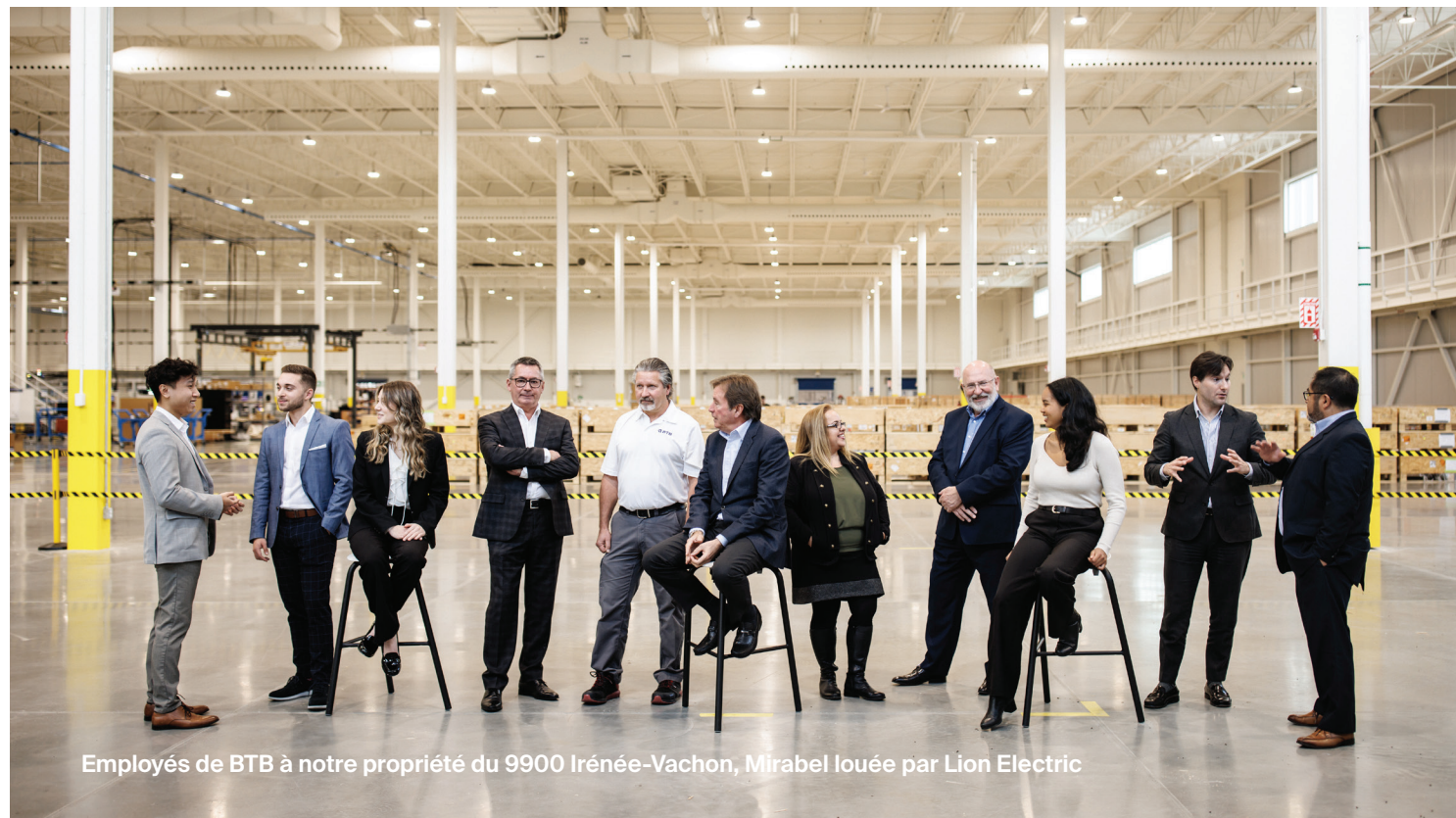
Employés de BTB à notre propriété du 9900 Irénée-Vachon, Mirabel louée par Lion Electric

Nous investissons dans des immeubles industriels, des immeubles de bureaux en dehors des centres-villes et des immeubles commerciaux de première nécessité, pour le bénéfice de nos investisseurs. La stratégie d'investissement de BTB est axée sur les marchés primaires, la réputation de nos clients, la vision à long terme et les possibilités de réaménagement. BTB est coté à la Bourse de Toronto (TSX).