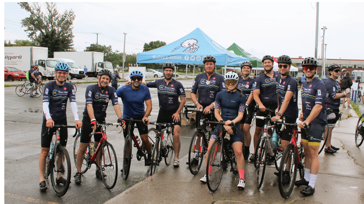
L'équipe de cyclistes BTB au Tour CIBC de la Fondation Charles-Bruneau, juillet 2023

En 2023, 50 % des gestionnaires de BTB étaient des femmes. Nous maintiendrons désormais un minimum de 50 % de femmes dans les postes de gestion. Par ailleurs, 33 % de notre conseil des fiduciaires sont des femmes.