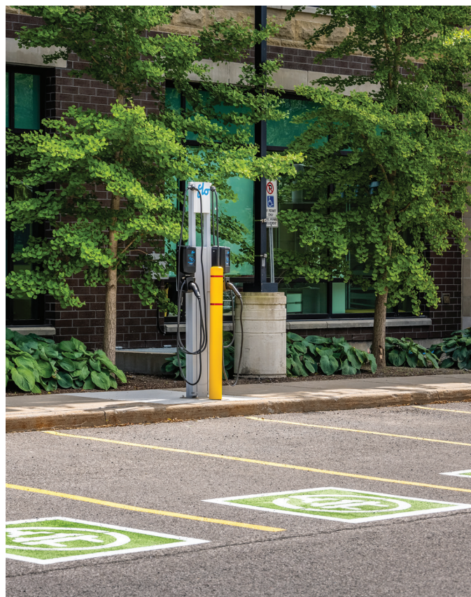
Bornes de recharge pour VE installées en 2023 2611 Queensview Drive, Ottawa, ON